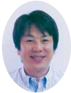
パラリンピアン (車椅子バスケットボール) 根木慎志さん

岡山県出身。2000年シドニーパラリンピックの車椅子バスケットボール日本代表チームキャプテンとして出場。現在は全国各地で子どもたちに向けて講演会や体験会を行っている。日本パラリンピアンズ協会副会長。