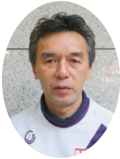
パラリンピアン (陸上競技・自転車競技) 葭原滋男さん

埼玉県出身。1992年バルセロナ大会に出場し、陸上・走り高跳びで4位。1996年アトランタ大会以降の3大会で金1(2000年シドニー大会・自転車競技1kmタイムトライアルで当時の世界新記録)、銀2、銅1のメダルを獲得。