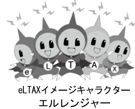
eLAXイメージキャラクター エルレンジャー

ページやダイレクト納付のほか、クレジットカード納付も可能です。 詳細は下記ホームページ等をご覧ください。