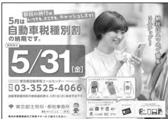
(写真2) 納期等周知ポスター 令和6年5月