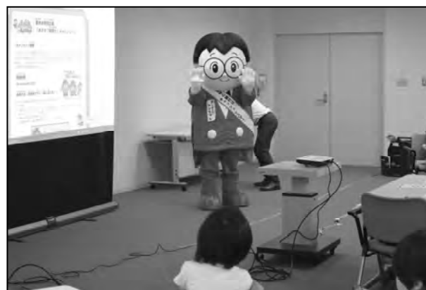
(写真3) 夏休み親子税金教室の様子