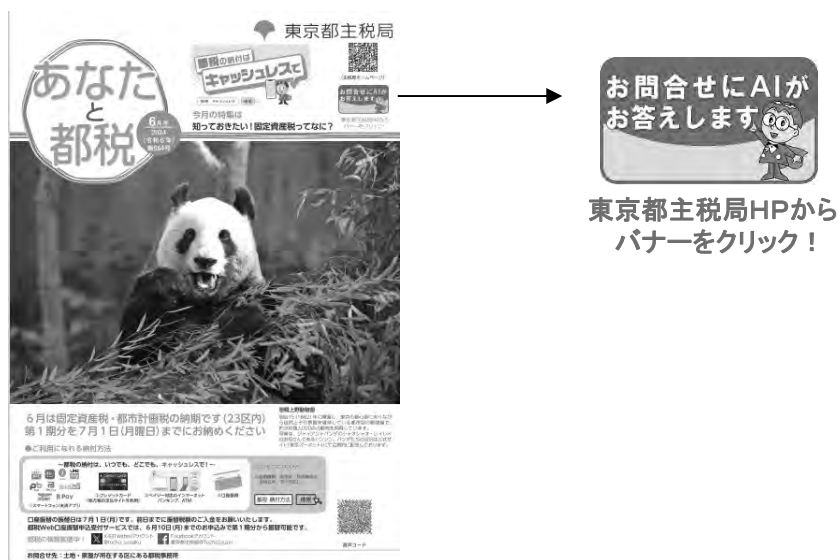
(写真1) 「あなたと都税」令和6年6月号

主税局ホームページは、利用者にとって、見やすく、操作しやすいものとなるよう運用しており、重要なお知らせはトップページ最上部に設置する等、必要な情報を随時発信している。