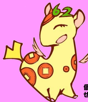
個人住民税PRキャラクター ぜいきりん

東京都と都内区市町村はオール東京で、平成29年度から原則として全ての事業主の方に、特別徴収義務者の指定を実施しますので、事業主の方は、ご理解・ご協力をお願いいたします。