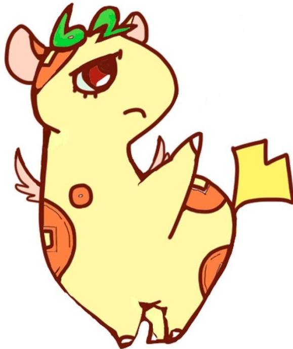
個人住民税PRキャラクター 「ぜいきりん」

東京都と都内全 62 区市町村は、 平成 29 年度から個人住民税の 給与からの特別徴収を徹底します。