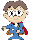
主税局イメージキャラクター タックス・タクちゃん

申告期限（令和3年2月1日）を過ぎてしまった場合、軽減措置を受けることができなくなります。お早めにご申告いただきますようお願いいたします。