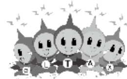
eLTAxイメージキャラクター エルレンジャー

事業所税の電子申告・申請、電子納税をご利用ください ページやダイレクト納付のほか、クレジットカード納付も可能です。 詳細は下記ホームページ等をご覧ください。